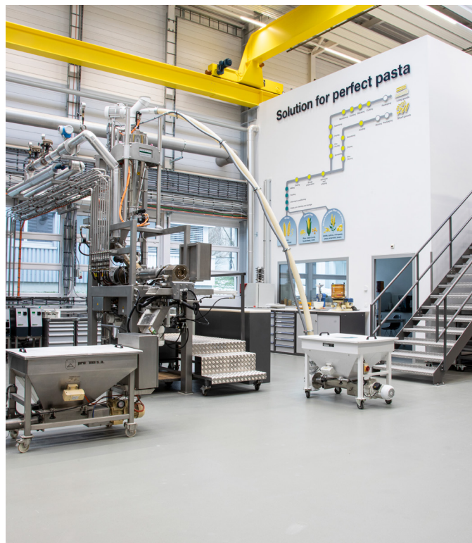
Due miliardi di persone consumano ogni giorno alimenti prodotti con i macchinari Bühler.

Prima della migrazione a S/4HANA, Bühler gestiva l'80% del proprio fatturato su un sistema globale One-Client con oltre 80 sistemi periferici. Questo sistema comprendeva più di 30 aziende con oltre 8000 utenti e, tra le altre cose, gestiva 2500 progetti clienti, oltre 100'000 ordini di assistenza, 2,6 milioni ordini di produzione, 2,2 milioni ordini di acquisto, così come 160'000 consegne all'anno. Nell'ambito della sua strategia di digitalizzazione, Bühler aveva già come obiettivo l'aggiornamento del suo ERP globale. Il momento è sembrato propizio, in quanto la soluzione attuale stava gradualmente raggiungendo la fine del suo ciclo di vita.