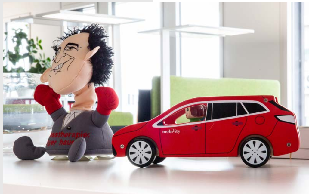
La miniature d'une voiture Mobility au site de l'entreprise à Risch-Rotkreuz.

ainsi de solutions intelligentes de reporting, d'analyse et de planification qui permettent à tous les secteurs de l'entreprise de prendre des décisions fondées. Le point fort : les utilisateurs peuvent créer tableaux, graphiques et évaluations de manière autonome et totalement indépendante du service IT.