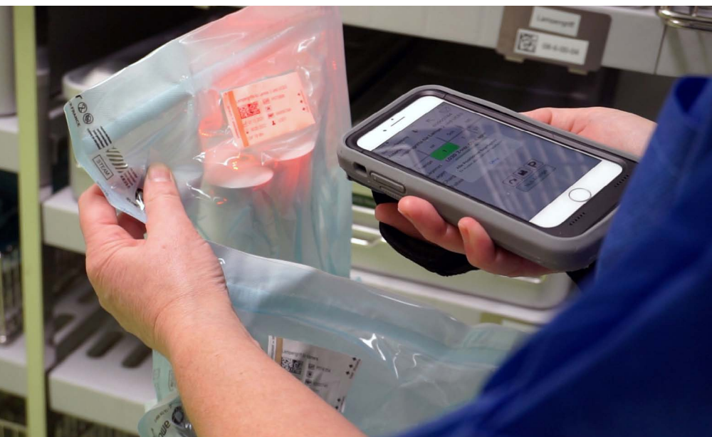
Des solutions de digitalisation simples sont utilisées dans tous les services.

La solution personnalisée a permis d'introduire le processus de logistique opératoire spécialement conçu par le Claraspital. « Cela n'était possible qu'avec SAP », explique Gasser. Avec cette étape d'innovation, l'hôpital a fait œuvre de pionnier en collaboration avec Swisscom. « Nous sommes le premier hôpital de Suisse à avoir mis en place un tel flux de matériel opératoire durable. Swisscom a fait ici un travail grandiose. Ils savent tout simplement ce que signifie être un partenaire SAP. »