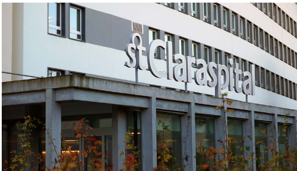
L'entrée principale du Claraspital à Bâle, dans la Kleinriedenstrasse.