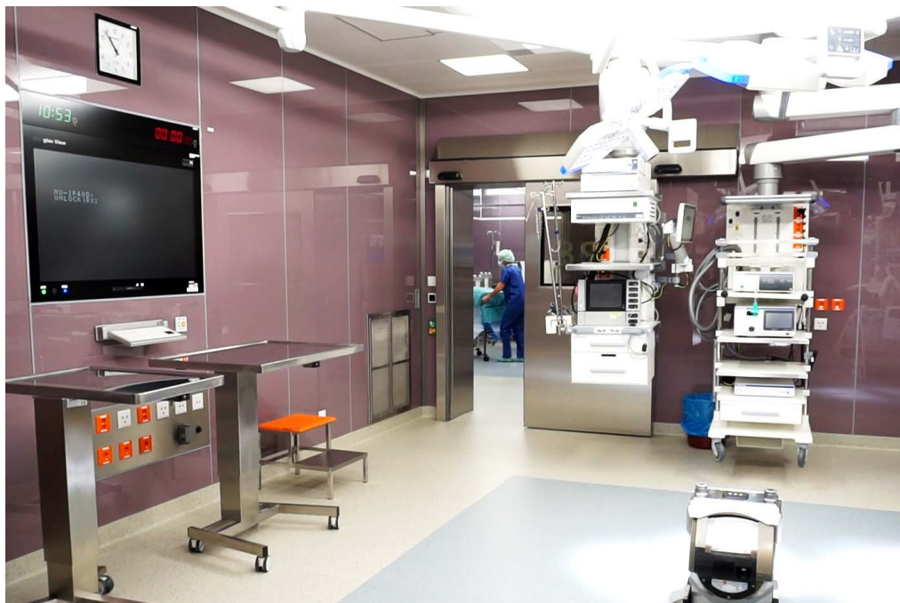
Le logiciel sait quel matériel est nécessaire en fonction des opérations et fournit la liste appropriée pour la logistique du bloc opératoire.

« Peu de programmes sont capables de reproduire à l'identique des processus spécifiques à un secteur. SAP a pu nous offrir cela. » Outre la logistique, la digitalisation complète des données des patients, l'optimisation de la gestion de la pharmacie et l'évolutivité du logiciel constituaient également des exigences pour la nouvelle solution d'entreprise. « Notre ancien logiciel ERP n'était plus extensible et n'était donc plus adapté à l'avenir. »