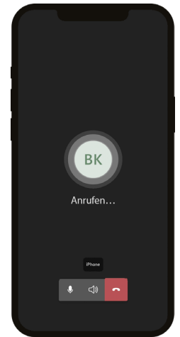
App mobile per iOS e Android

L'esperienza con Teams è uguale su tutti i device; questo semplifica l'utilizzo.